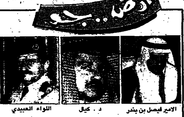
الأعضاء في نادي الفرق

صاحب السمو الملكي الأمير فيصل بن بندر بن عبدالعزيز أمير منطقة عسير نائب أمير منطقة عسير مدير جامعة الاندلس والفنون بأبها الأستاذ أحمد عسيري تقديراً لدوره الجماعي وجهودها ونشاطاتها المختلفة بالمنطقة